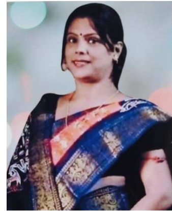
ଛବି ରାଣୀ ପତି

ମୋର ମହମ ଭଳିଆ ମନକୁ ମହମବତୀ କରି ଭେରୁ ଜାଳିଲୁ ଦେଖିଲୁନି ଥରେ ମାତ୍ର ମୋର ଦେହାବଶେଷ କୁ ତରଳିଲା ନାହିଁ ବି ତୋର ସେ ନୃଶଂସିଆ ଛାତିଟା ।